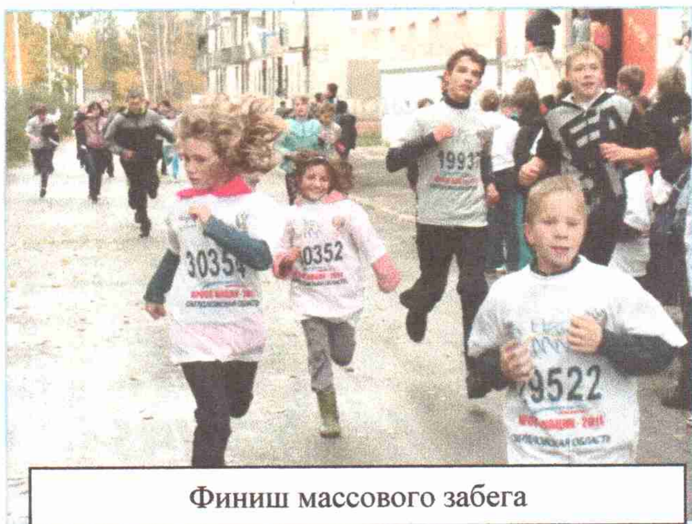
Финиш массового забега

В 2008 году впервые приняли участие люди с ограниченными физическими возможностями – 20 человек. Всего в забеге приняли участие 1699 человек.