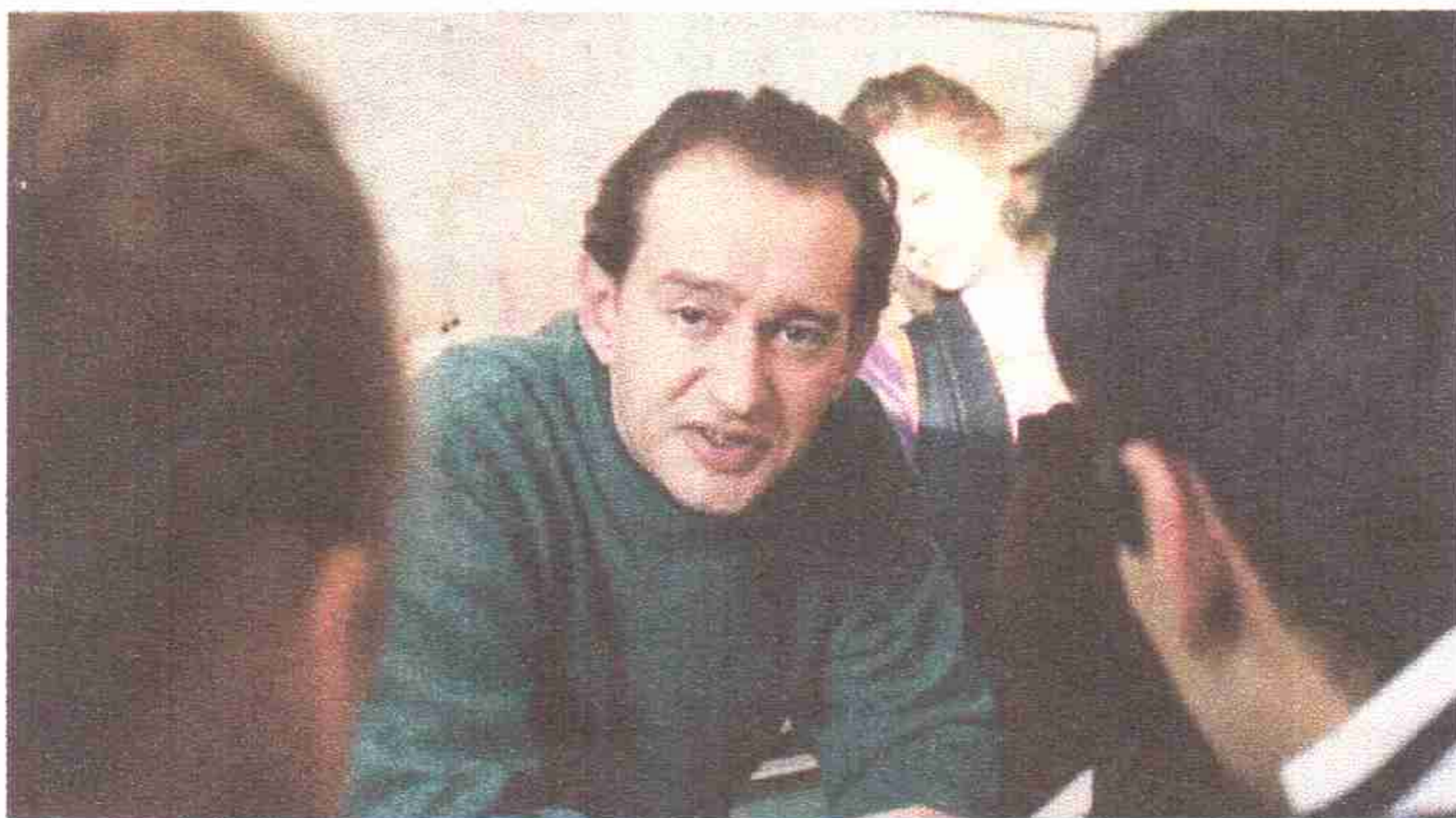
Кадр из фильма «Географ глобус пропил»

В 2016 году Иванов сыграл самого себя в одной из серий сериала «Физрук».